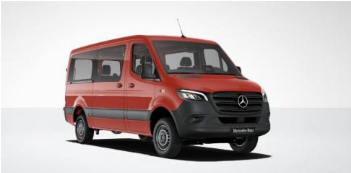
Mercedes-Benz Sprinter 319 CDI PRO KB 3665mm S

Als Ersatz für den jetzigen Toyota möchte man einen neuen Mercedes-Benz Sprinter 319 CDI PRO KB 3665mm S anschaffen, welcher eine hohe Nutzlast, Allrad und genügend Platz für den Personentransport sowie das nötige Material aufweist.