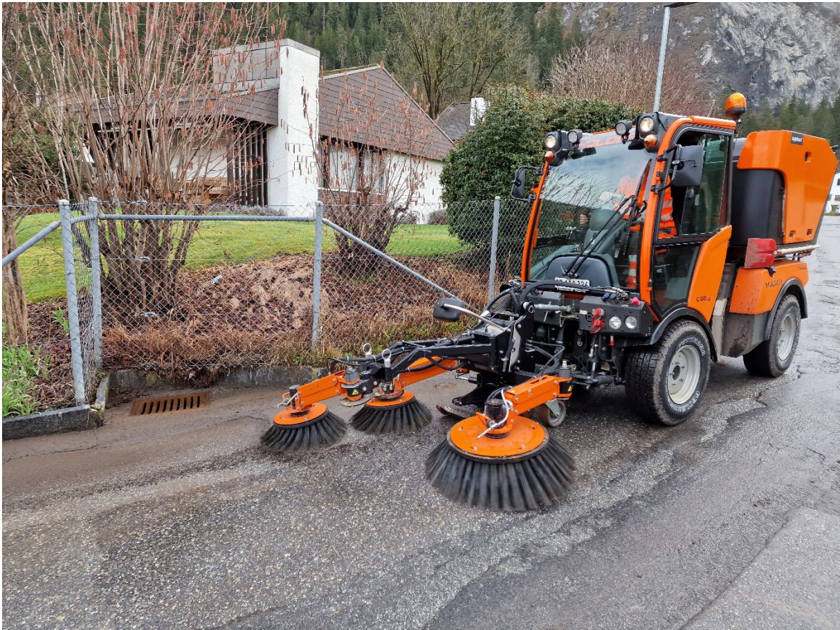
Abbildung 2: Bild der Kehr- und Sauganlage während dem Testbetrieb im Jahr 2023

Für die Anschaffung im Jahr 2024 ist im Investitionsbudget ein Betrag von Fr. 80'000.- vorgesehen.