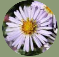
Bergaster Aster amellus