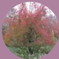
Schwarzdorn Prunus spinosa