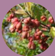
Pfaffenhütchen Euonymus europaeus